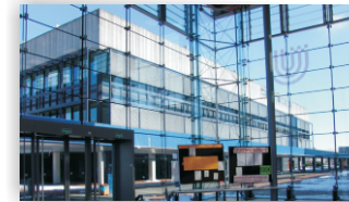
University of Bremen