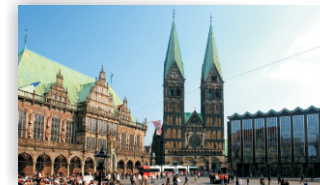
Bremer Market Square