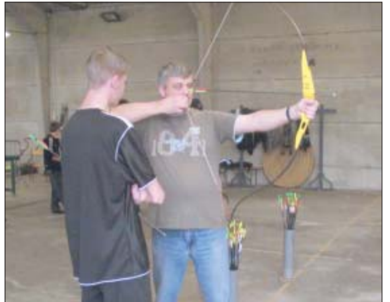
Le club des archers a permis aux nombreux visiteurs de s'initier à la discipline.