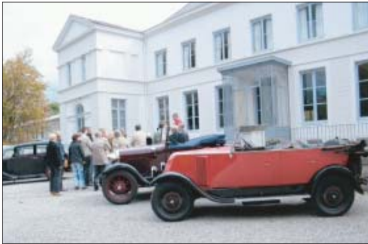
Plusieurs voitures anciennes ont trouvé un magnifique cadre d'exposition au château Duriez.

Charlotte Vandebussche-Duriez était la cheville ouvrière de ces journées à Steene. « Nous avons, cette année encore, attiré un nombreux