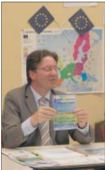
Les collèges d'Hondschoote et Gravelines se mettent au flamand.