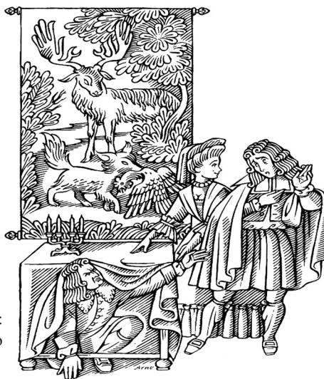
Illustration de couverture : Enrico Arno